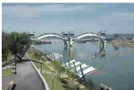
图5 南京外秦淮河三汊河河口闸

可望(图8)。加上闸区周围以治水文化、海塘文化、流域文化、星宿文化、观潮文化为主题的水文化附属设施建设,使曹娥江大闸在发挥重大水利效益的同时,也成为浙东新的文化景点,现已成为国家水利风景区,并于2011年获中国建筑工程“鲁班奖”。