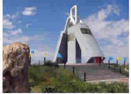
图 14 用废旧闸门建造的“同心锁”