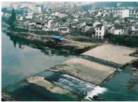
图3 鱼梁坝另一端——古镇民居

广阔、开放的自然空间之中,比一般建筑更加注意与周围环境的和谐。成功的水工程建筑物看起来不是生硬摆放的人造物体,而好像是从周围的生态环境中自然生长出来的,体现了“人力营造”与“天公造化”的和谐统一。鱼梁坝的选址和建筑就是体现了这一特点。古代的都江堰、灵渠,当今的三峡工程,更是如此。