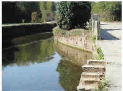
图 11 皖南水口

文化的内容。水口,不仅担负着村落入口、分界、用水、防卫、休闲、绿化等功能,也是村民命运前程的一种精神象征。徽州人将水口看作地之门户,视建水口为创基业,每个村落水口都是精心布局设计。水口,置于村头或路口,是整个村中风景最美的地方。百年古树,枝繁叶茂,树冠如盖;有怪石嶙峋,有亭榭庙宇,有石桥、泉水叮当,一派生机盎然。山、水、树是徽州水口的三大要素。理想的水口是,两山对峙,涧水环匝村境。水口林是聚集村中旺气的屏障,力求达到“绿树村头合”的意境,而潺潺流水,则是水口布局的灵魂,在选景位置上常以桥“锁关”,辅以亭、堤、塘、树等镇物(图 11~12)。民间工匠在水工程中融入了造园工艺,体现了朴素的美学元素,使水口散发着浓浓的人文气息。水口有“水口坦”,可供村人聚会、或男女老少玩憩。随着水口的不断营建,这里就会成为村中风光宜人之处,溪流潺潺,花红柳绿,山清水澈,塔亭屹立。不仅地方俊彦流连于此,咏答唱和,父老兄弟出入息,也相会于此,聊天作乐,呈现出一派祥和与宁静。“水口”的建造,体现了“道法自然”的原则。从精神角度看,水口的风水观念来自徽州的地域文化传统;从物质角度看,与徽州得天独厚的自然条件密切相关:这里有山,有水,植被茂盛,树木葱茏,降水充沛,水流长年不息。在此自然环境之内生活,讲究天人合一,融入徽俗民情,荟萃生活情趣,使人与自然和谐,成为具有浓郁地域特色的乡村水工程。在村落用水的实用功能之外,凝聚了更多的人文功能和美学功能,具有较高的文化品位,并逐渐形成了别具一格的水口文化。