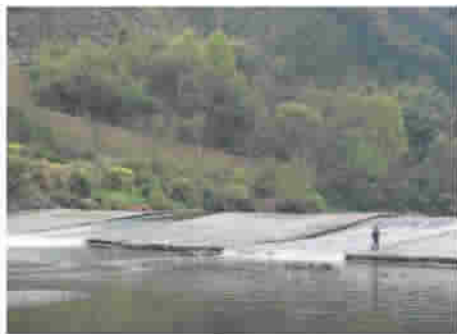
图2 鱼梁坝一端——青山

其实,鱼梁坝这样的古代水工程,不能用“一看就很漂亮”的标准来衡量。从水工程建筑角度看,鱼梁坝有很多值得品位的美学元素。古代没有混凝土浇筑,用数量众多的巨石砌成大坝,坝身坡降合理,整体线条流畅,与流水之势浑然一体,实属高超的建构。坝身又有高低之分,枯水季节也可以保证游鱼通过。坝的一端连接苍翠的青山,另一端与白墙黛瓦、鳞次栉比的皖南民居相邻(图2~3),构成一幅天人合一的优美画面,具有较高的美学含量。