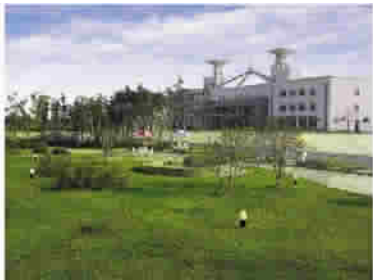
图 9 江苏泰州引江河工程的沃特龙酒店

较大规模的水工程,通常在主体工程之外还有一些附属建筑(如服务设施),并有植被、绿化、形象标志等,它们都是水工程景观的组成部分。特别是依托水工程的水利风景区,这些附属物作为风景区的组成部分,其形象美也是文化内涵和品位的体现。如江苏泰州引江河工程,是一条长 24 km 的人工河道,南连长江,北接新通扬运河,纵贯泰州城区。引江河的建设,在有形功能方面,是增强南水北调的供水能力,提高里下河地区和通南地区的灌排标准,促进苏北地区的航运发展,为苏北地区改善水质、沿海冲淤保港、实施滩涂开发提充足水源。在工程建设中,不仅水闸、船闸造型新颖独特,而且通过园林手法在沿河两岸进行植物配置,把引江河建成了江苏省第一条生态化、园林化的综合性水利工程,被誉为“东方莱茵河”,充分发挥了水环境的生态功能和环境功能。景区内建造了旅游酒店——沃特龙(英语“water”与汉语“龙”结合而成的词语)大酒店,还建有标志性雕塑——飞扬的“水”字(图 9~10)。2005 年,引江河工程成为国家水利风景区,是江苏省较早进入国家水利风景区的水工程单位,多年来已成为颇有名气的旅游目的地。