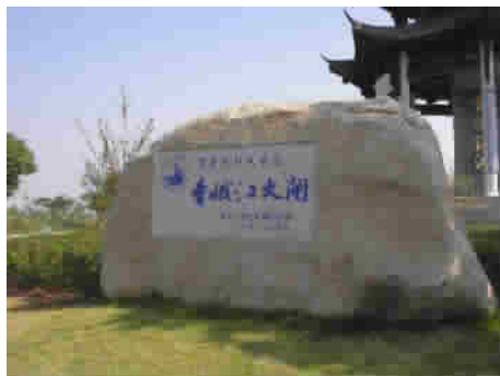
图7 浙江绍兴曹娥江大闸2