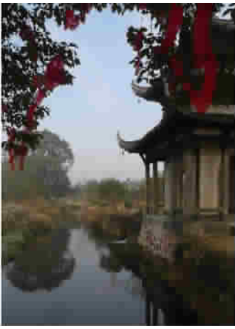
图 12 亭台建筑

主要体现在工程建造和管理方面。中国古代水工程留下了一些成功的范例,如都江堰的竹笼、马槎、“羊圈”、卧铁等治水工具,现在已成为具有地域文化特色的水文化载体。但在当前高科技时代,交通便利,信息快捷,地域之间的距离在缩小(全世界都即将成为一个“地球村”),差异在减少,古代社会存在的地域文化特色在今天会逐渐淡薄甚至消失。地域文化个性和美学特色在高科技时代受到冲击,这是社会发展带来的新问题。而在地域文化诸多领域之中,工程建筑比方言、饮食、民俗、服饰等方面发生的变化更要快。具体到水工程来看,目前在科技尺度的统一作用下,工程材料同质化(最基本的材料是钢筋、混凝土),技术手段通用化、建筑风格西方化,以至于南方与北方、内陆与沿海之间,水工程在美学风格上雷同多,个性少。新建水工程,似乎越来越难以保持地域文化的美学特色。其实,只要重视发掘地域文化因素并自觉追求,即使在高科技的时代,依然能够找到创新途径。特别在工程建筑的样式、风格和配套设施等方面,与地域文化有着较大的结合空间。如国家级水利风景区黄河三盛公水利枢纽工程,是“万里黄河第一闸”。工程位于黄河主河道与引黄总干渠(“二黄河”)分启处,是内蒙古河套地区引黄灌溉的咽喉,具有重要的社会价值。其地域文化特色也很鲜明,工程枢纽指挥中心的主体建筑,下部是汉族平房造型,上部为蒙古包造型,体现出该地区民族文化的亲密融合(图 13)。工程区内还建造了“同心锁”雕塑。雕塑主体由永固、永昌、永恒三把巨锁锁环相扣,昂然鼎立,高 27 m,重 240 t,被誉为“天下第一锁”(图 14)。锁体利用废弃闸门建造,命名预示黄河安澜,雕塑具有鲜明的水利行业文化特色,而且蕴含着该地区黄河母亲哺育下的华夏儿女永结同心的美好愿望,象征着河套地区汉、蒙等多民族的和谐共处。工程中的这些文化元素,显示了浓