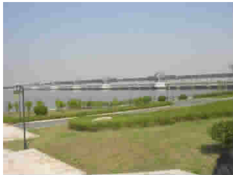
图8 浙江绍兴曹娥江大闸远眺