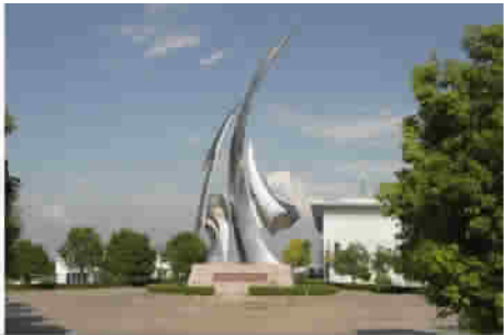
图 10 江苏泰州引江河工程的“水”字雕塑