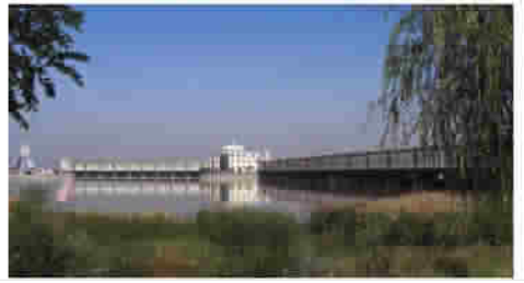
图 13 内蒙古黄河三盛公水利枢纽指挥中心 (图中左侧为同心锁)

主要体现在工程建造和管理方面。中国古代水工程留下了一些成功的范例,如都江堰的竹笼、马槎、“羊圈”、卧铁等治水工具,现在已成为具有地域文化特色的水文化载体。但在当前高科技时代,交通便利,信息快捷,地域之间的距离在缩小(全世界都即将成为一个“地球村”),差异在减少,古代社会存在的地域文化特色在今天会逐渐淡薄甚至消失。地域文化个性和美学特色在高科技时代受到冲击,这是社会发展带来的新问题。而在地域文化诸多领域之中,工程建筑比方言、饮食、民俗、服饰等方面发生的变化更要快。具体到水工程来看,目前在科技尺度的统一作用下,工程材料同质化(最基本的材料是钢筋、混凝土),技术手段通用化、建筑风格西方化,以至于南方与北方、内陆与沿海之间,水工程在美学风格上雷同多,个性少。新建水工程,似乎越来越难以保持地域文化的美学特色。其实,只要重视发掘地域文化因素并自觉追求,即使在高科技的时代,依然能够找到创新途径。特别在工程建筑的样式、风格和配套设施等方面,与地域文化有着较大的结合空间。如国家级水利风景区黄河三盛公水利枢纽工程,是“万里黄河第一闸”。工程位于黄河主河道与引黄总干渠(“二黄河”)分启处,是内蒙古河套地区引黄灌溉的咽喉,具有重要的社会价值。其地域文化特色也很鲜明,工程枢纽指挥中心的主体建筑,下部是汉族平房造型,上部为蒙古包造型,体现出该地区民族文化的亲密融合(图 13)。工程区内还建造了“同心锁”雕塑。雕塑主体由永固、永昌、永恒三把巨锁锁环相扣,昂然鼎立,高 27 m,重 240 t,被誉为“天下第一锁”(图 14)。锁体利用废弃闸门建造,命名预示黄河安澜,雕塑具有鲜明的水利行业文化特色,而且蕴含着该地区黄河母亲哺育下的华夏儿女永结同心的美好愿望,象征着河套地区汉、蒙等多民族的和谐共处。工程中的这些文化元素,显示了浓