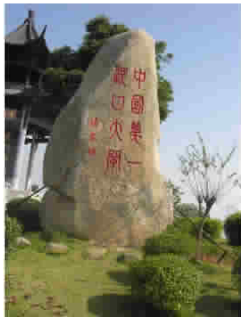
图6 浙江绍兴曹娥江大闸1