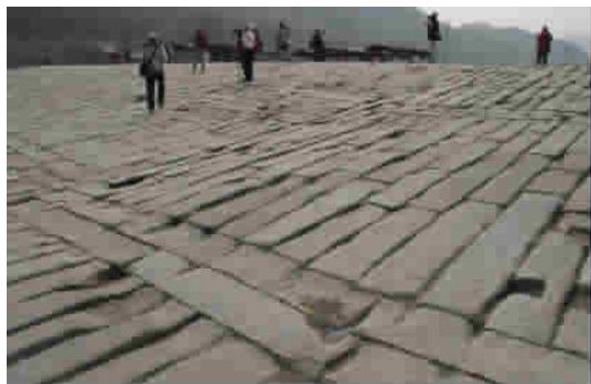
图1 皖南鱼梁坝坝身

如,被誉为“皖南都江堰”的鱼梁坝,是古代徽州(歙县)最大的水利工程,它建在新安江支流——练水之上,是由巨石砌成的滚水坝,既可蓄上游之水,便于灌溉,以利通航,也可缓坝下之流,可以防洪。坝身高低间隔,鱼类可以在坝上激流中通过,不妨碍其巡游,故名“鱼梁”。坝始建于唐宋年间,现存石坝为明代重建。如此著名的水工程,由于是矮坝,在枯水季节,单看其坝身,以条形石块砌成,年深日久,局部有许多坑坑洼洼,乍看并不雄伟(图1)。因此,有一些游客网上留言,评价为“一般般”。