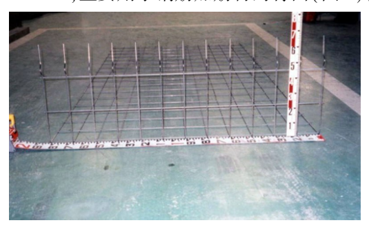
图 1 普通钢筋加筋材

陆埠水库除险加固工程中防汛抢险道路采用吉奥加筋生态挡墙技术,设计要点如下<sup>[5-6]</sup>:吉奥加筋生态挡墙的构件主要有钢筋加筋材、背面材、吉奥土工网、绿化网带、斜拉材等,其中钢筋加筋材按照使用位置的不同分为普通钢筋加筋材和上端调整用钢筋加筋材。本段挡墙的钢筋补强材分为3种:第1种为普通钢筋加筋材,宽度1800 mm,是主要的加筋材,用于除顶部及最上段以外的范围(图1);第2种为上端调整用钢筋加筋材,宽度也为1800 mm,用于挡土墙的最上一层(图2);第3种为钢筋背面材,宽度1950 mm,主要用于钢筋加筋材的背面(图3)。