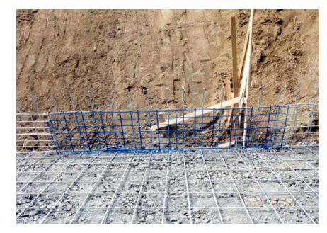
图 3 钢筋背面材

靠近墙面的一头被预先加工成向上弯起的钩状,这向上弯起的部分便构成了墙面骨架。向上弯起部分的长度要根据挡墙层厚和墙面勾配(坡比)来决定,本段挡墙墙面勾配为1:0.2。