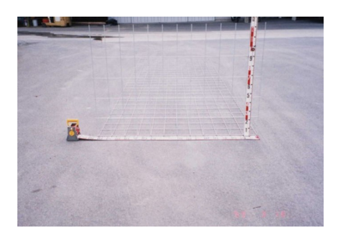
图 2 上端调整用钢筋加筋材

吉奥加筋生态挡墙分层水平构筑施工,本段挡墙层厚为43 cm。吉奥加筋生态挡墙的钢筋补强材同时构筑了挡墙的墙体和墙面部分,使之成为一个整体。补强材一片一片地拼铺在下承面上,每片网宽度方向为路基纵向,长度方向为路基横向,每片网