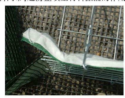
图 4 土工网

在整个钢筋补强材墙面部分(弯起部分)的背面设置背面材,在背面材的整个背面设置吉奥土工网,在土工网的背面设置绿化网带。钢筋背面材为宽度1950mm的镀锌钢筋网片,起搭接补强材间隙的作用。吉奥土工网为宽度为440mm的长条状高强度塑料网带,起防止填土材料撒漏的作用(图4)。